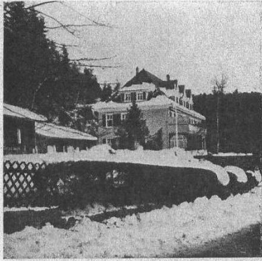
Pforzheim—Wildbad. Die Entfernung von Calmbach beträgt 5 km. Fernsprechan schluß Wildbad 364.

Die Kinderstation liegt von den übrigen Krankenbauten für Erwachsene ungefähr 100 m entfernt. Sie ist in einem neuzeitlich eingerichteten, nach Süden gelegenen Haus untergebracht, 50 Kinder und Jugendliche im Alter von 3 bis 15 Jahren können darin Aufnahme finden.